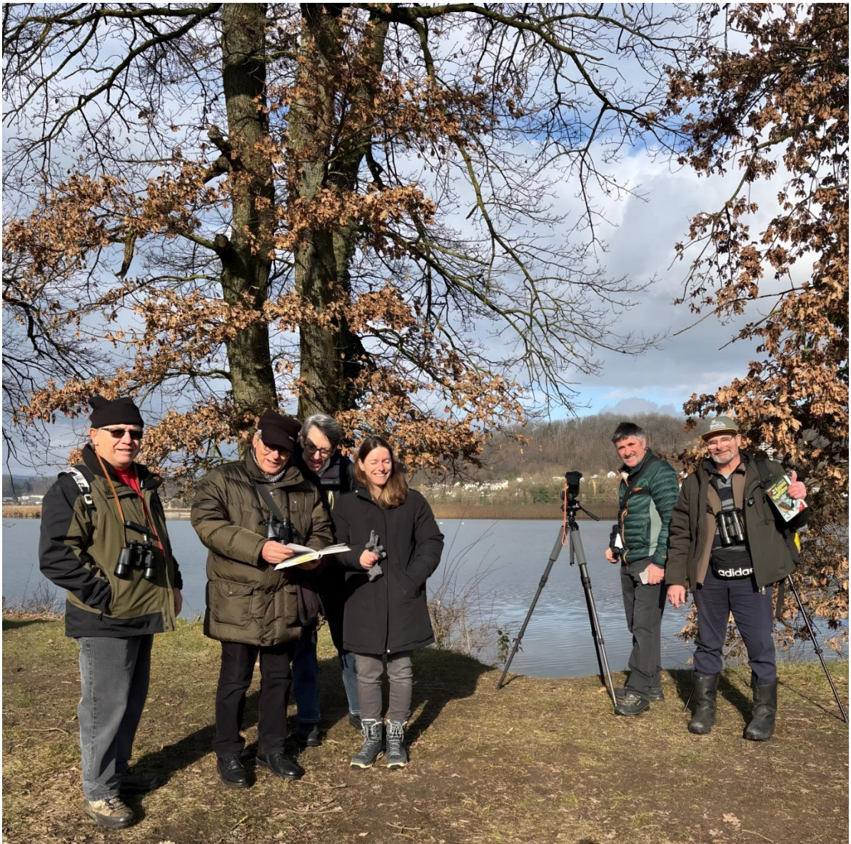
ein paar Mitglieder