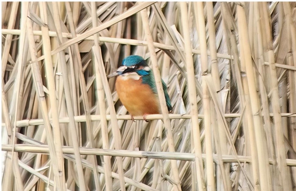
Eisvogel, Vogel des Jahres 2026